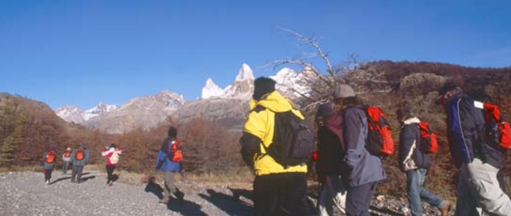
Los circuitos de trekking se extienden al oeste de El Chaltén, entre los ríos Eléctrico (al norte) y Fitz Roy (al sur). Es importante hacer el camino de la mano de un guía experimentado.